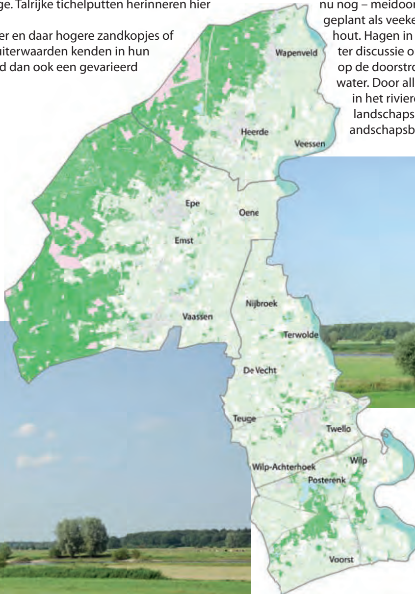
Uiterwaarden langs de IJssel

Op veel plaatsen kwamen vroeger – en ook nu nog – meidoornhagen voor. Ze werden geplant als veekering en voor boerengeriefhout. Hagen in de uiterwaarden staan nu ter discussie omdat ze ongunstig werken op de doorstroming van de rivier bij hoog water. Door allerlei ruimtelijke projecten in het riviereengebied staat het huidige landschapsbeeld ter discussie. Een nieuw landschapsbeeld zal ontstaan.