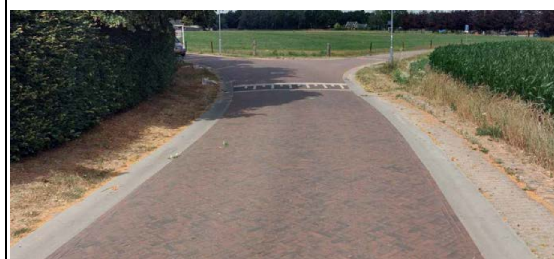
VOORBEELD SITUATIES (BEATRIXWEG)