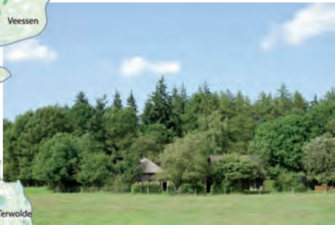
Bossen bij Gortel