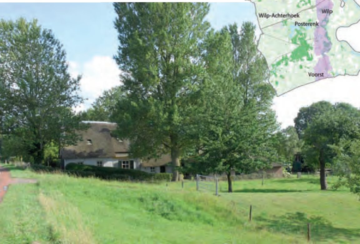
Boerderij Swarte Peert bij Terwolde

Vanaf Twello ligt richting het noorden tot en met het gebied rond Wapenveld een aaneengesloten oeverwal langs de IJssel. De rivier is hier redelijk stabiel geweest. Dit in tegenstelling tot een meer versnipperde en onduidelijke overwal ten zuiden van Twello. Om overstromingen tegen te gaan werden aan de rivierzijde dijken op de oeverwal aangelegd. Bijzonder is de aanwezigheid van allerlei bijzondere landschapselementen, zoals kolken, gemalen en landgoederen. Een bijzonder kenmerk zijn de IJsselhoeven op de oeverwal.