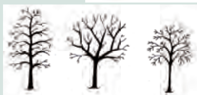
Peer, appel, pruim of kers