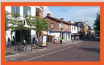
Nieuwe Zakelijkheid en gezondheid