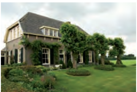
De moestuin is helemaal niet meer aanwezig.