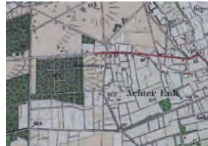
Landschap rond 1930