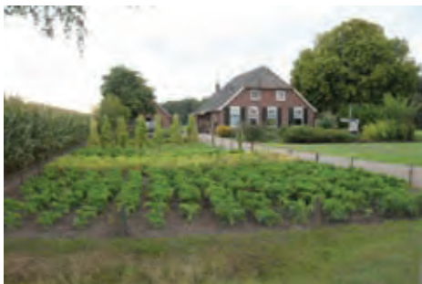
De moestuin ligt voor het huis.

Boerenerven betekenen veel voor het landelijk gebied. Tegenwoordig is er bij de grote en lange stallen een harde grens ontstaan tussen bebouwing en landschap. De gebouwen staan kaal in het land. Dit komt door het verdwijnen van beplanting op kavelgrenzen, door de vorm en maat van de gebouwen en door de toename van erfverharding. De visuele verandering op het achtererf is daardoor groot. De passant en u misschien ook, vindt het over het algemeen niet mooi. Ook voor op het erf is veel veranderd. De moestuin verdwijnt langzamerhand. Deze brochure geeft suggesties hoe u door het aanbrengen van beplanting deze veranderingen kunt verkleinen.