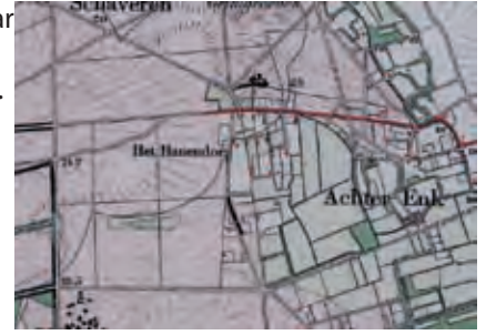
Landschap rond 1900

boerenland gaan maar ook landschappen met elkaar verbinden. Ook allerlei dieren profiteren van een aantrekkelijk landschap.