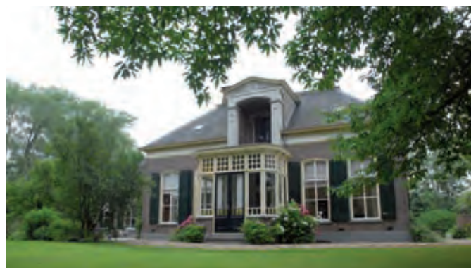
IJsselhoeve de Blankemate

Een bijzonder kenmerk zijn de IJsselhoeven op de oeverwal. IJsselhoeven zijn de karakteristieke boerderijen en erven in de IJsselvallei. Het zijn T-boerderijen, voornamelijk gelegen in het landschap langs de IJssel, met verschillende bijgebouwen zoals een of meerdere hooibergen, een houtschuur, een wagenloods, schuur, een bakhuis, een tanklokaal en kippenhok. Vaak zijn deze boerderijen via een doodlopend en beplant weggetje bereikbaar. Ook hier gold de indeling in 'voor' en 'achter'. Overigens moet deze indeling ook weer niet al te letterlijk worden genomen, zeker niet langs de IJssel. Als er geld verdiend werd, kwam er soms een grotere siertuin de zogenaamde slingertuin voor de voorgevel van de boerderij, waardoor het hele erf meer status kreeg. De moestuin en de boomgaard voor eigen gebruik verhuisden naar de zijkant van het erf.