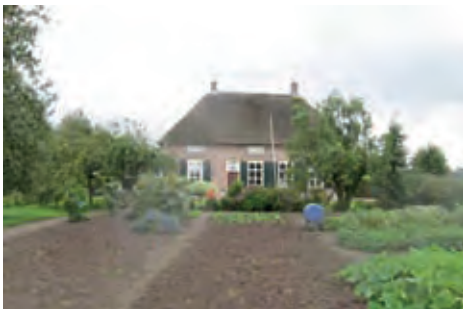
Moestuin en siertuin liggen achter elkaar.