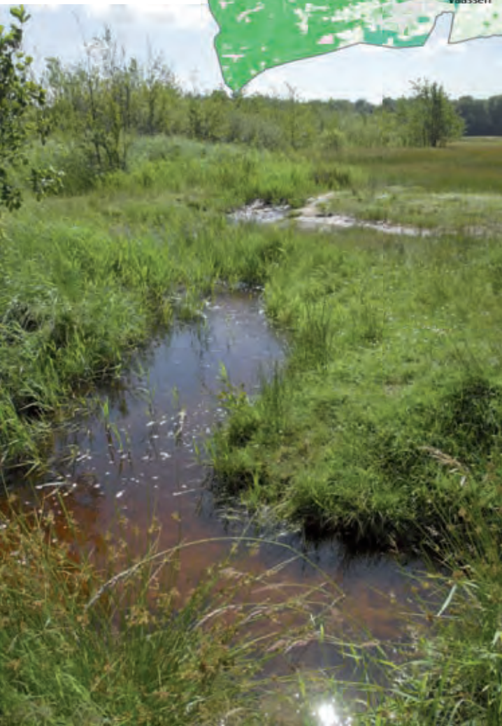
Beek bij Wisselse Veen

Apeldoorn zijn over het algemeen ondiep en iets breder dan in de noordelijke IJsselvallei. De beken hebben een gekanaliseerd profiel en zijn door het sterk wissellende landschapsbeeld langs de beken niet goed herkenbaar in het landschap.