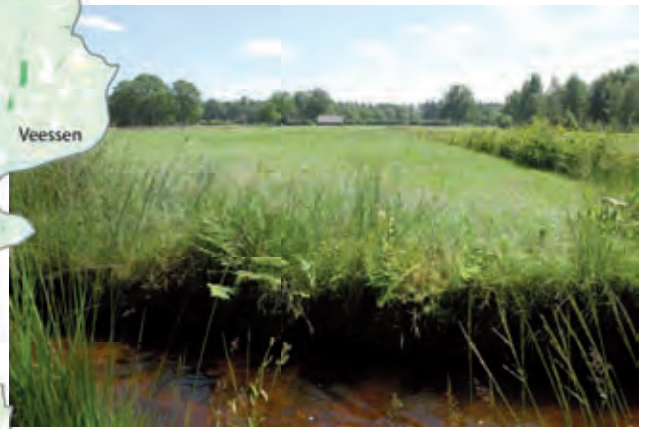
Beek bij Epe

De beken en beekdalen liggen vaak in de nabijheid van de hogere oude gronden en soms in kernen waardoor ze slecht herkenbaar zijn in het landschap.