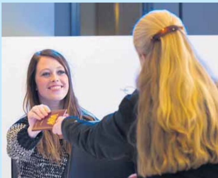
Andere gegevens vanuit het team Burgerzaken: